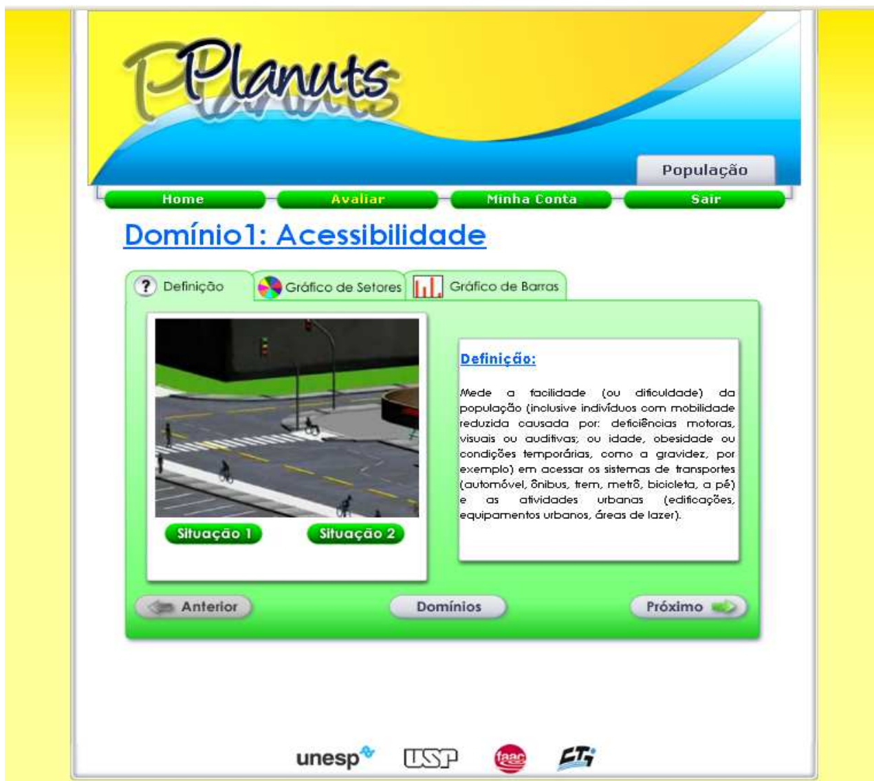
Página de Definição de Domínio

Após escolher um Domínio, a pessoa passa para a página de Definição do Domínio, como é mostrado a seguir.