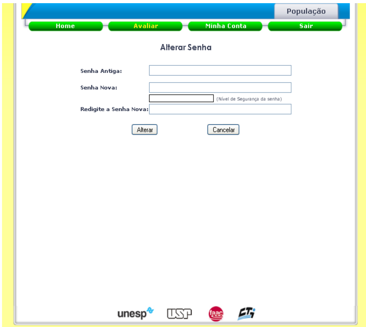
Página de Alterar Senha

Nessa página, para que a senha seja alterada, primeiramente, é necessário que o usuário digite sua senha atual no campo “Senha Antiga”. Em seguida, no campo “Senha Nova” inserir a nova senha e repeti-la no campo “Redigite a Senha Nova”. Ao inserir uma senha nova, uma barra indicará o nível de segurança da mesma. Caso a senha seja considerada fraca, a barra ficará vermelha; no caso de uma senha de intermediária a barra se torna amarela, ficando verde se a senha inserida seja segura.