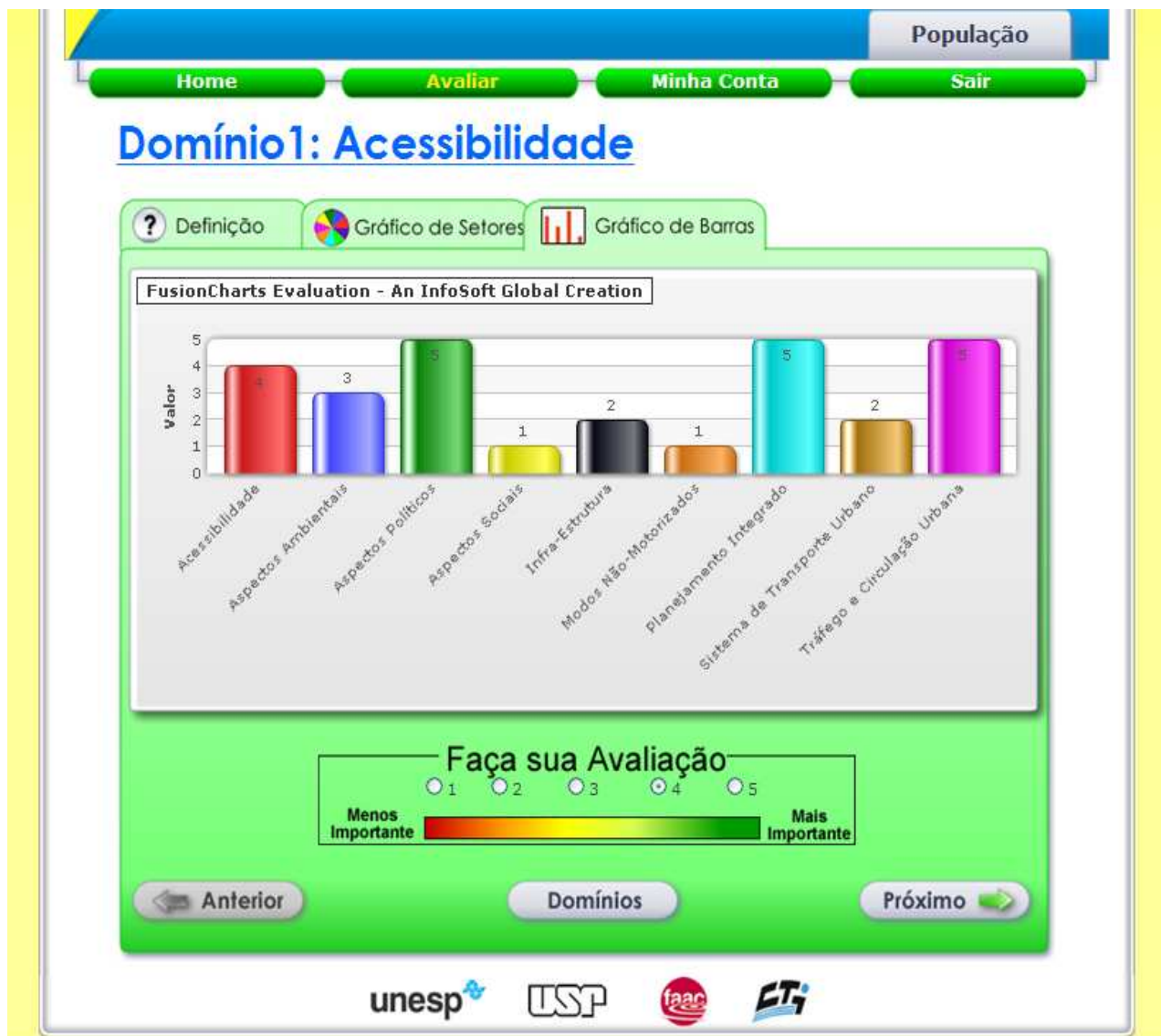
Página de Avaliação por Gráfico de Barras

Nessa opção – escolhida ao se clicar sobre a aba Gráfico de Barras – o usuário realiza a avaliação e os resultados parciais são apresentados por meio de um gráfico de barras.